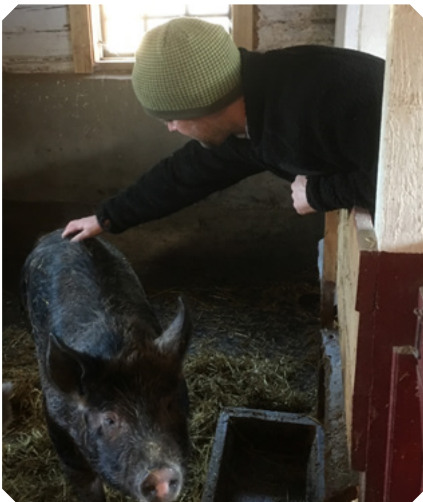
Det finns många djur i herrens hage och en del finns i Patriks ladugård.