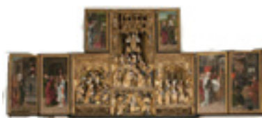
Altarskåpet i Dillnäs kyrka

På skärtorsdagen minns vi hur Jesus åt sin sista måltid med lärjungarna, måltiden som sedan dess har varit uttryck för djup andlig samhörighet med Kristus och varandra. Efter att vi firat måltid tillsammans kläs altaret av, altarskåpen stängs, och vi släcker alla ljus. Skärtorsdagsmässan kommer att äga rum i Dillnäs kyrka kl 19.00.